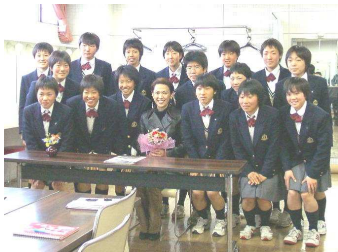
残念ながら男子部員は翌日大会のため欠席でした。

学生の間は「くん」や「さん」は、「ちゃん」や「あだ」感覚で男女差の意識はない。が、社会に出ると……。豊川市内のA社では、「新入社員も上司も〇〇さん呼びに変えたら、新入社員は自分が大切にされていると感じ。全体的に上下関係のギスギスがなくなり会社の中の雰囲気がとてもよくなった」という話がありました。